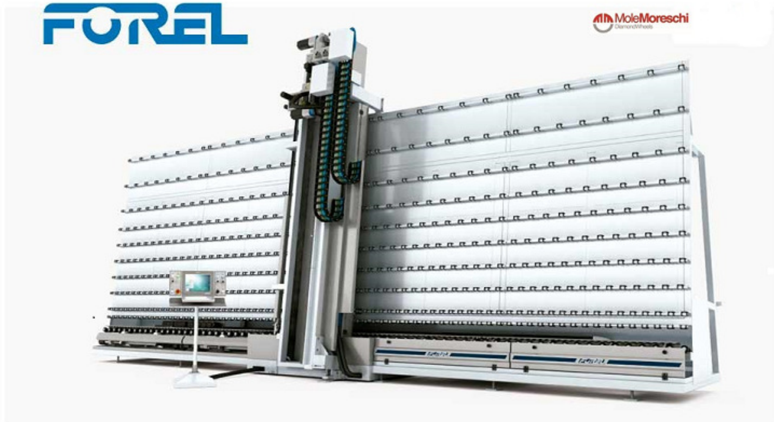
CANTEADORAS MODELOS EM Y GM